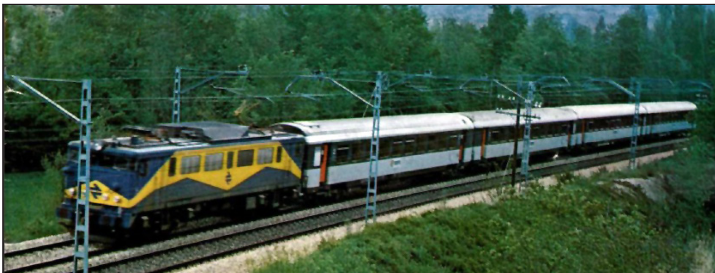
Tren "Corail" con tracción de una 269 subserie 600; un coche de 1ª Clase y tres de 2ª. Foto: © Vía Libre, 1982.

La librea era igual para todas las Clases, a excepción de una banda superior que recorría cada uno de los laterales, amarilla para los coches de 1ª Clase y verde para los de 2ª. El resto del coche empleaba tres colores: gris oscuro para los bajos, una banda algo más alta que las ventanas y a su altura, y el techo; color gris claro en dos bandas, una inferior, más ancha, y otra por encima de las bandas de Clase y hasta el comienzo del techo. Las puertas, tanto las exteriores como las de intercomunicación, en color naranja. En el centro de cada lateral, una pegatina con el logo de RENFE en sus colores (azul y amarillo) y la palabra RENFE (en azul) con la tipografía que empleaba la empresa en esa época.