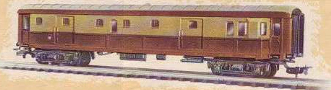
N° 1651.- Coche furgón, enganche automático, ocho ruedas, masosa. Largo 23'5 cm.