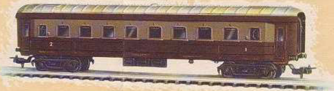
N° 1653.- Coche pasajeros, enganche automático, ocho ruedas, 1.ª y 2.ª, marrón. Largo 23'5 cm.