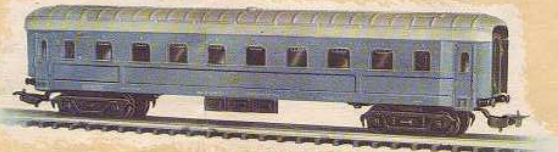
N° 1655.- Coche pasajeros, enganche automático, ocho ruedas, 1.ª, azul. Largo 23'5 cm.