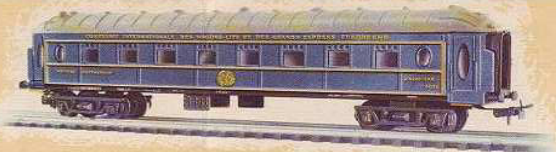
N° 1650.- Coche restaurante, enganche automático, ocho ruedas, axial. Largo 23'5 cm.