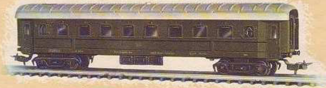
N° 1654.- Coche pasajeros, enganche automático, ocho ruedas, 1.ª, verde. Largo 23'5 cm.