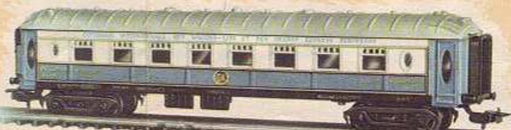
N.º 1600.- Caja pulman, argancha automática, ocho ruedas, azul y blanco. Largo 23'5 cm.