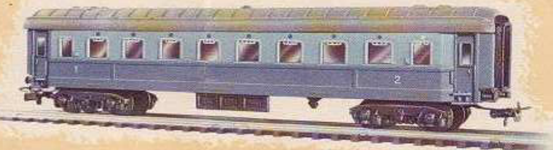
N° 1652.- Coche pasajeros, enganche automático, ocho ruedas, 1.ª y 2.ª axial-clase. Largo 23'5 cm.