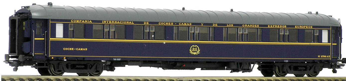
Lado departamentos Foto: © José M. García Olgado, noviembre de 2018.

98 015. Coche WL-2796, tipo S2. Fabricado por Les Ateliers de Construction Metallurgiques S.A. en Nivelles, Bélgica, en 1926. Pasó a Portugal en 1941. Circuló por España en el Lusitania y en el Sudexpress. La CP lo adquirió en 1978.