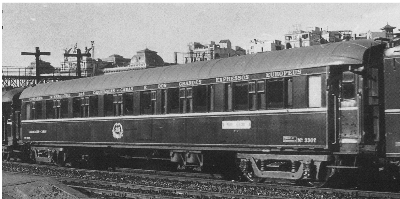
WL 3307 tipo S 1, Madrid-Atocha, mayo de 1968.

Originalmente venían de fábrica con 16 plazas, 4 en departamentos de una cama (single) y en 6 de dos camas (dobles). Entre departamentos dobles, un pequeño lavabo compartido y en los extremos, dos aseos (uno de ellos con lavabo). Dependiendo de la distribución de los departamentos y el número de plazas se distinguen los siguientes subtipos: S 1, S 2, ST, SG, SGT, STU, STm, S 3, S 3K y S 4. El total de coches tipo S fue de 189 unidades, fabricados entre 1922 y 1930 por diversos constructores ingleses, franceses, italianos, alemanes y austriacos. A España llegaron 86 coches (el 45,5 % del total), en diferentes momentos. Los primeros en 1928 para la Compañía del NORTE (M.Z.A. declinó su uso por considerar que al ser metálicos serían muy calurosos para sus líneas) y los últimos en 1958.