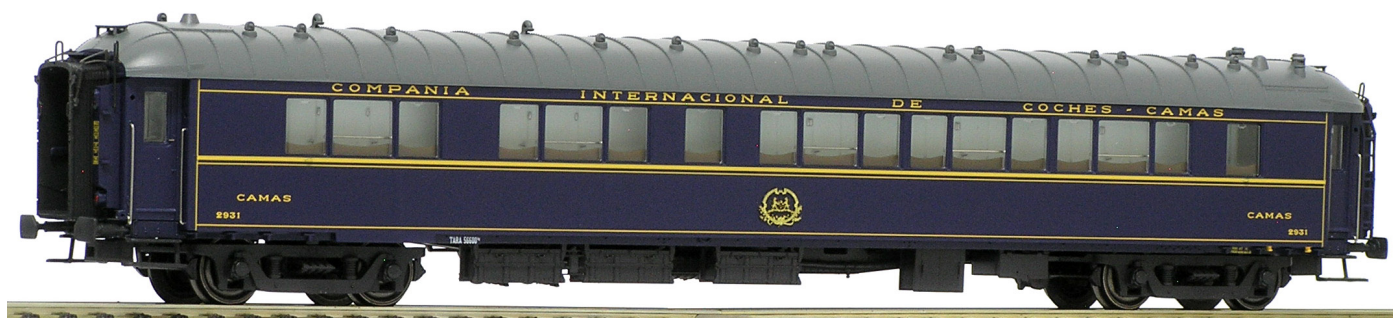
Lado pasillo Fotos: © José M. García Olgado, noviembre de 2018.