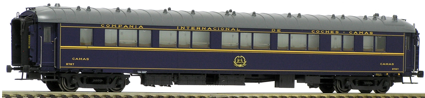
Lado pasillo Foto: © José M. García Olgado, noviembre de 2018.

98 016 [2]. Coche WL-2931 [51 66 06 10037 3], tipo S3. Fabricado por The Birmingham Railway Carriage and Wagon, Co. en Smethwick, Gran Bretaña, en 1926. Pasó a España (junto a otros seis coches de la misma serie en año no precisado pero entre 1949 y 1951. Se convirtieron a S 3 (llegaron en estado de origen, como S 1) entre septiembre de 1958 y febrero de 1962. Más tarde, en 1977, pasaron a ser ST, con 24 plazas.