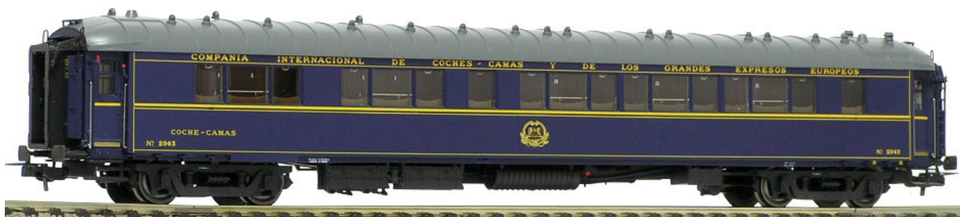
Lado pasillo