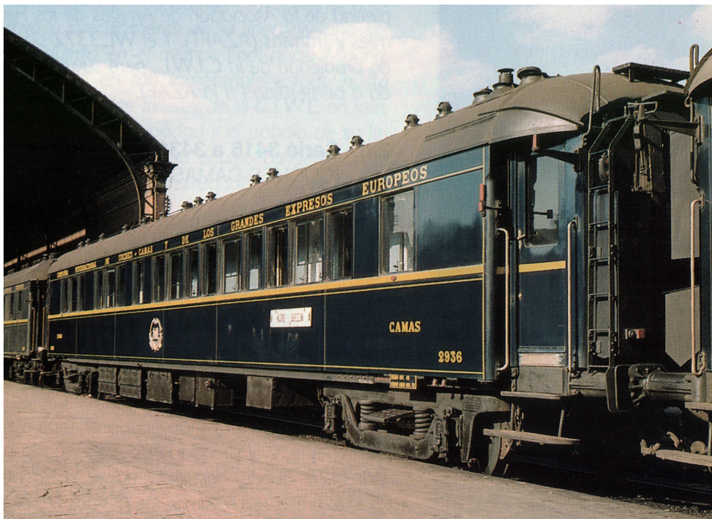
WL 2936 tipo S 3, Madrid-Atocha, mayo de 1965, expreso Madrid-Barcelona.

Durante toda su vida útil estos coches llevaron la librea "clásica" de la CIWL (inaugurada con ellos): azul marino y ribeteado en amarillo con el escudo en bronce. La rotulación, en nuestro caso, en español (lado pasillo) y en portugués (lado departamen-